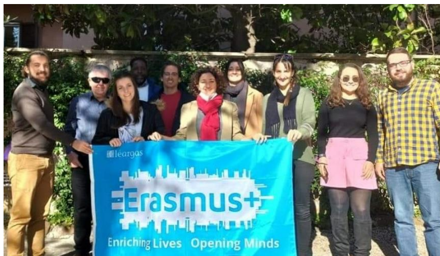
Transnational Kick-off partnership meeting in Rome, November 2021

DigiGuide combina il convalidato metodo dei Casi di Studio con una nuova dimensione digitale e mira a massimizzare il potenziale dell'apprendimento interattivo, mantenendo l'alto valore di scambio, interazione e identificazione che è stato il punto di forza dei precedenti progetti Guide. Scopri di più nel nostro sito web del progetto